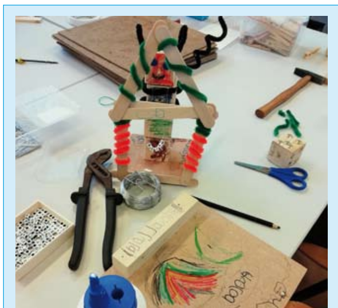
Mooie producten bij Kleurtechniek.