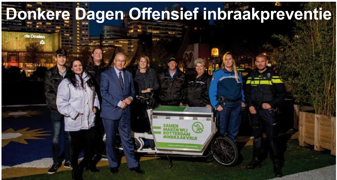
Burgemeester Aboutaleb gaf afgelopen vrijdag, bij het vallen van de avond, het startsein voor het Donkere Dagen Offensief inbraakpreventie.

De klok is een uurtje terug gegaan en de winter staat weer voor de deur. Nu het steeds vroeger donker wordt, neemt de kans op inbraak helaas ook toe. Tijdens het 'Donkere Dagen Offensief' zetten we ons in om bewoners van Pendrecht te helpen met vijf praktische tips die de kans op een inbraak met 50% verminderen. Kan ik ook op uw hulp rekenen?