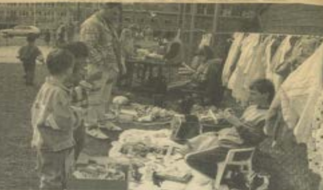
Op de vrijmarkt bij de Kerkwervingel werden goede zaken gedaan.