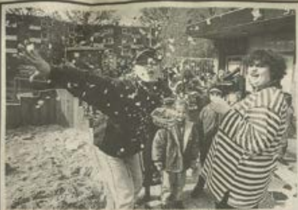
Vrolijke gezichten na 'bestorming' van speeltuin Pendrecht.