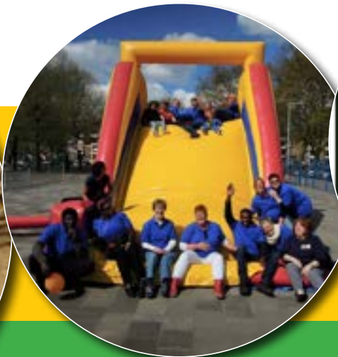
Het team van de speeltuin in 2015.