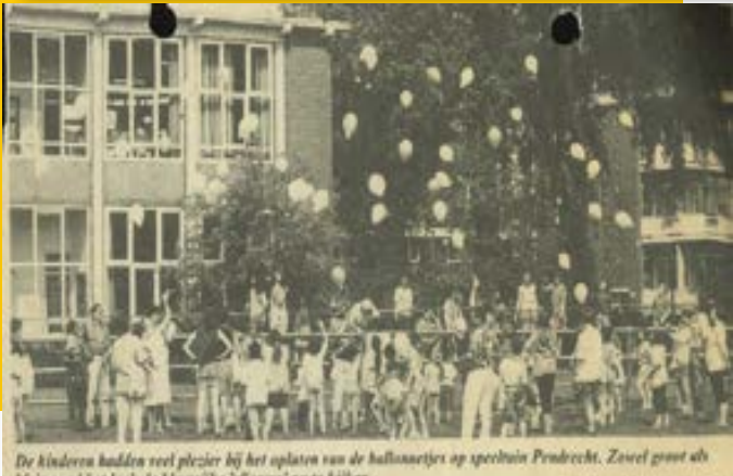
De kinderen hadden veel plezier bij het oplaten van de ballonnen op speeltuin Pendrecht. Zowel groot als klein vond het leuk de kleurrijke 'vliegers' na te kijken.