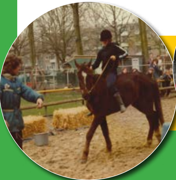
Paard rijden in de speeltuin.

Speeltuin Neeltje Jans blijft daarmee, net als al 70 jaar lang, een plek vol herinneringen, ontmoeting en gezelligheid voor de wijk.