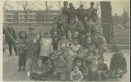
Dezelfde brengen een groot aantal kinderen uit de buurt meer van de club bij Speeltuinvereniging Pendrecht 1.

PENDRECHT - Speeltuinvereniging Pendrecht 1 was in 1950 de eerste speeltuin die in de buurt van jong en oud werd gevestigd. De kinderen van hun beestenboel en speelplek werden nu samen in één clubgebouw, de club, en konden bij de speeltuin terecht komen. Na ruim 40 jaar is SV Pendrecht 1 nog altijd de plaats waar jong en oud samen zijn bij de vereniging. De clubgebouw van Pendrecht 1 viert zijn veertigste verjaardag.